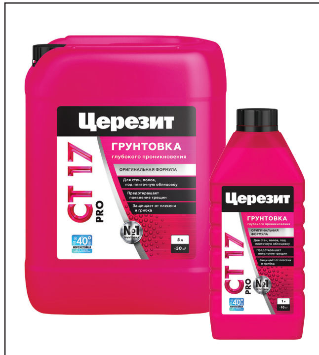
ЦЕРЕЗИТ_CT 17 PRO_11. 2024

После высыхания грунтовки проверить основание на впитывающую способность и, при необходимости, обработать еще раз. При креплении керамических плиток на цементные и цементно-известковые основания с использованием клеев, например, Церезит группы CM, к креплению плитки можно приступать через 15 минут после грунтования. Сильно впитывающие основания, например, ячеистый бетон, рекомендуется грунтовать не менее